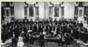
Mantova, Teatro Bibiena - Ricercare