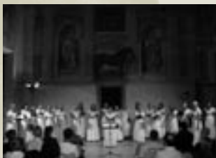
Mantova, Coro TV Estone