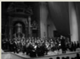
Siena, Accademia Chigiana - Ricercare