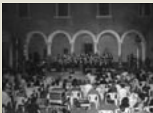
Revere, Cori a Palazzo