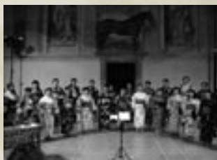
Mantova, Coro di Tokyo