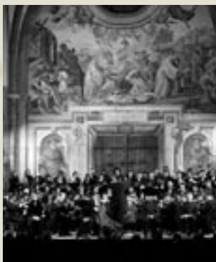
Milano, Mozart Fest - Ricercare