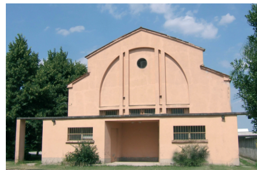
Il Teatro di Moglia di Sermide