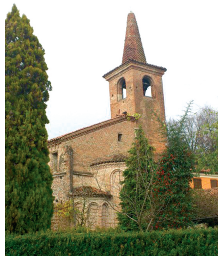
Oratorio di Sant'Andrea del Ghisone

In località Ghisone sorge il tesoro artistico del paese, l'antico Oratorio matildico dedicato a S. Andrea. Costruito sul luogo occupato in precedenza da una villa romana, la struttura, sostanzialmente intatta, è romanica, con belle absidi e altri caratteri che ricordano le costruzioni matildiche di oltrepò. L'oratorio è totalmente realizzato in cotto. La parte più antica è costituita dalle tre absidi, dai muri laterali e da una piccola parte della facciata, mentre il campanile fu aggiunto verso la fine del XV secolo.