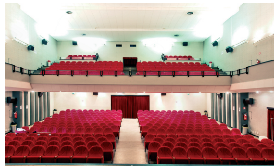
La nuova veste del Teatro "Mario Monicelli"

Nell'anno 1812 un certo Carlo Gobbi da Sermide, saputo che ad Ostiglia fioriva un'acclamata Compagnia di Filodrammatici, prese in affitto un palazzo allora di proprietà di Vincenzo Baglioni, che l'aveva acquistato dai Conti Pellicelli, già appartenuto ai Gonzaga e trasformò una vasta sala a piano terreno in Teatro. Nella primavera del 1838, per iniziativa del concittadino Bernardino Ghinosi, amministratore del Marchese Annibale Cavriani e del Civico Ospedale, venne costituita una Società per Azioni che si assunse il compito della costruzione del Teatro a cui venne dato il nome, per l'appunto, di Sociale. Il 25 Aprile 2011 il Teatro è stato intitolato a Mario Monicelli.