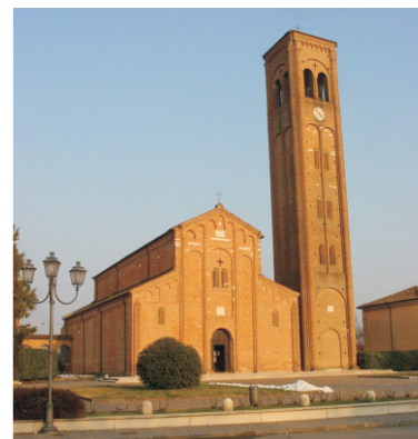
Chiesa Matildica di Pieve di Coriano