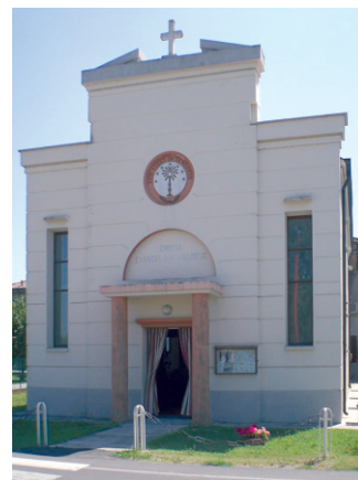
La Chiesa Evangelica Valdese di Felonica